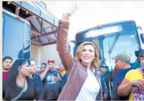
La gobernadora Marina del Pilar Avila extendió el "Borrón y Cuenta Nueva".

El programa "Borrón y Cuenta Nueva" extiende su vigencia hasta el 31 de mayo, anuncia la gobernadora Marina del Pilar Avila Olmeda.